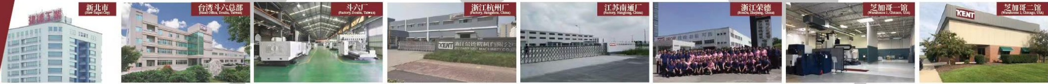
新北市 (New Taipei City)

越南地区 - 平阳 VN KENT PRECISION MACHINERY CO.,LTD