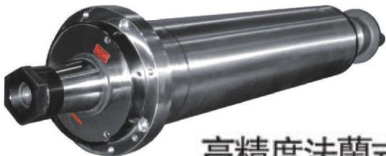
高精度法蘭式主軸